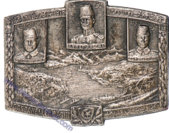
Lot: 91, Fiyat: 2.000 TL

1.DÜNYA SAVAŞI DÖNEMİ MİNELİ İTTİFAK HATIRA ROZETİ-Köşeleri yuvarlatılmış eşkenar ters üçgen formunda rozetin ortasında sağa dönük Türk bayrağı ve üçgenin kenarları boyunca Alman İmparatorluğu ve Avusturya-Macaristan İmparatorluğu bayraklarının renginde şeritler yer almaktadır. (Mineli, arkadan çengelli iğneli - Piriç üzeri altın kaplama)