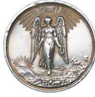
Lot: 95, Fiyat: 1.000 TL

İTTİFAK DEVLETLERİNİN ROMANYA FETHİ MADALYONU-1916 - İttifak Devletleri'nin karma kuvvetleri tarafından Romanya'yı işgalinden sonra çıkarılan madalyondur. Madalyonun ön yüzünde, Romanya Kraliyet tacı bulutlardan yıldırım çarpmış, altta bir kurdele üzerinde "ROMANYA DEVICTA", çevre yazısında ise "BUKAREST GENOMMEN 6 · 12 · 1916 · GEN FELDM V. MACKENSEN" .Arka yüzde ortada Almanya, Bulgaristan ve Avusturya-Macaristan'ın armaları yerilirken, çevresinde "BULGARIEN · DEUTSCHLAND · ÖST-UNGARN · KAMPFEN · EINIG · WIDER · RUMÄNIENS · VERRAT" yazmaktadır. (Ø40 mm - Çinko)