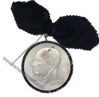
Lot: 98, Fiyat: 1.500 TL

1938 - TUNCELİ III.ORDU MANEVRASI HATIRASI MADALYASI-III. Ordu Tunceli Manevrası 24-26 Ağustos 1938 tarihinde yapılmıştır. Genelkurmay Başkanlığı'nca diğer manevralarda olduğu gibi Tunceli'de yapılan askerî tatbikatın anısına da madalya bastırılması uygun görülmüştür. Cumhurbaşkanı Atatürk, sağlık durumu iyi olmadığı için katılamazken Başvekil Celal Bayar, Genelkurmay Başkanı Fevzi Çakmak, çok sayıda üst düzey subay ve asker katılmıştır. Başta Darphane'ye manevraya katılacak subaylara verilmek üzere tunç veya sarı renkte 350 adet madalya siparişi verilmiştir. Daha sonra tüm subaylara ve gelecek misafirlere verilmesi için 1000 adet madalya daha basılması istemiştir. Hatta daha sonra yetmediği için 500 adet daha basımı yapılmıştır. Madalyanın ön yüzünde, çevrede "3. ORDU TUNCELİ MANEVRASI HATIRASI" yazısı, ortada K. Atatürk imzası ve altında "26-VIII 1938" tarihi yer alır. Madalyanın arkasında meşe dallarından bir çelenk içerisinde sola dönük hilal yıldız vardır. Madalyanın kurdelesini aslına uygun şekilde yeniden yapılmıştır ( İstanbul Darphanesi - Ø35 mm 15 Gr Bronz) UÖBG#CM101