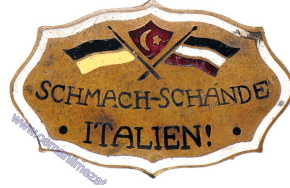
Lot: 92, Fiyat: 2.000 TL

1.DÜNYA SAVAŞI DÖNEMİ ÇANAKKALE SAVAŞI HATIRA ROZETİ-1916 - Avusturya - Macaristan İmparatorluğunun Çanakkale Boğazı Savunmasına destek için çıkardığı Şapka Rozeti. Rozetin tasarımı, arka fonda Çanakkale Boğazı görseli üzerine Liman Von Sanders, Enver Paşa ve Cevad Paşa Portre ve isimlerinin Osmanlıca ve Almanca yazılı olduğu çerçeler üst tarafa konumlanmıştır. Dış Çerçevenin üst tarafında Almanca "WELTKRIEG (Dünya Savaşı) 1915-1916", Osmanlıca "Harb-i Umumi 1334-1332" alt tarafta ise yine aynı sıra ile "DARDANELLEN WATCH (Çanakkale'yi Koruyoruz)" ile "Çanakkale Muhafızları" yazısı bulunmaktadır. Rozetin üzerinde marka bulunmamasına rağmen Viyana'daki G.Greini firması tarafından yapılmıştır. (41-31 mm - Alpaka)