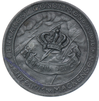
Lot: 94, Fiyat: 1.000 TL

İTTİFAK DEVLETLERİNİN ROMANYA FETHİ MADALYONU-1916 - İttifak Devletleri'nin karma kuvvetleri tarafından Romanya'yı işgalinden sonra çıkarılan madalyondur. Madalyonun ön yüzünde, Romanya Kraliyet tacı bulutlardan yıldırım çarpmış, altta bir kurdele üzerinde "ROMANYA DEVICTA", çevre yazısında ise "BUKAREST GENOMMEN 6 · 12 · 1916 · GEN FELDM V. MACKENSEN" .Arka yüzde ortada Almanya, Bulgaristan ve Avusturya-Macaristan'ın armaları yerilirken, çevresinde "BULGARIEN · DEUTSCHLAND · ÖST-UNGARN · KAMPFEN · EINIG · WIDER · RUMÄNIENS · VERRAT" yazmaktadır. (Ø40 mm - Çinko)