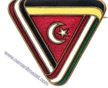
Lot: 90, Fiyat: 2.000 TL

1.DÜNYA SAVAŞI - GALİÇYA ASAKİR-İ OSMANİ MUAVENET CEMİYETİ ROZETİ-1916 - Rozet tasarımı, çember şeklindeki çerçeveye üstten kurdele ile bağlı İttifak devletlerinin bayraklarının yer aldığı mineli İsviçre tipi kalkan ile çerçevenin arka tarafında sağ ve solda yer alan 2 adet çelenk bulunmaktadır. Çerçevenin etrafında Osmanlıca "Galiçya'daki Asakir-i Osmani Muavenet Cemiyeti - 1916 Hatırası 1334" yazısı yer almaktadır. (Mineli, Piriç üzeri gümüş kaplama)