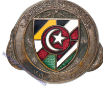
Lot: 89, Fiyat: 2.000 TL

1.DÜNYA SAVAŞI GALİÇYA CEPHESİ ROZETİ-1916 - Rozetin ön yüzünde, bir kalkan içinde cephe mizanseninin solunda yer alan Enveriye üniformalı kalkanın dışına taşan vaziyette sancak tutan Osmanlı askeri Rusya'yı sembolize eden kılıç ve süngü yemiş vaziyette cephede yerde yatan ayının üzerinden sağ tarafta yer alan Osmanlı İmparatorluğunu simgeleyen ufuktaki cami ve arkasından doğan güneşe doğru bakıyor. Kalkanın sol tarafında defne yaprağı, sağ tarafta zeytin dalı yer alırken üst dış tarafında XV.KAIS.OSM.AKMEE. KORPS. yazısı,iç üst kısmında ise Osmanlıca "Onbeşinci Kolorduyu Humayun" yazısı bulunmaktadır. Rozetin alt kısmında sırasıyla Avusturya-Macaristan İmparatorluğu, Osmanlı İmparatorluğu ve Alman İmparatorluğu amblemleri yer alırken, bunların hemen altında Osmanlıca "Galiçya Hatıra-i Zaferi (1)915-(1)916 yazmaktadır. (Gustav Gurschner Atolyesi - Viyana İmalatı - Piriç Rozet)