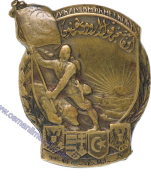
Lot: 88, Fiyat: 2.000 TL

1.DÜNYA SAVAŞI GALİÇYA CEPHESİ ROZETİ-1916 - Rozetin ön yüzünde, bir kalkan içinde cephe mizanseninin solunda yer alan Enveriye üniformalı kalkanın dışına taşan vaziyette sancak tutan Osmanlı askeri Rusya'yı sembolize eden kılıç ve süngü yemiş vaziyette cephede yerde yatan ayının üzerinden sağ tarafta yer alan Osmanlı İmparatorluğunu simgeleyen ufuktaki cami ve arkasından doğan güneşe doğru bakıyor. Kalkanın sol tarafında defne yaprağı, sağ tarafta zeytin dalı yer alırken üst dış tarafında XV.KAIS.OSM.AKMEE. KORPS. yazısı,iç üst kısmında ise Osmanlıca "Onbeşinci Kolorduyu Humayun" yazısı bulunmaktadır. Rozetin alt kısmında sırasıyla Avusturya-Macaristan İmparatorluğu, Osmanlı İmparatorluğu ve Alman İmparatorluğu amblemleri yer alırken, bunların hemen altında Osmanlıca "Galiçya Hatıra-i Zaferi (1)915-(1)916 yazmaktadır. (Gustav Gurschner Atolyesi - Viyana İmalatı - Piriç Rozet)