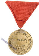
Lot: 97, Fiyat: 3.000 TL