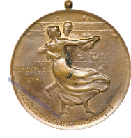
Lot: 96, Fiyat: 5.000 TL

KIRIM SAVAŞI SONRASI PARİS BARIŞ ANTLAŞMASI İÇİN ÇIKARILAN HATIRA MADALYON-1856 - Madalyanın Ön Yüzünde, büyük puntolarla İngilizce "COMMEMORATION OF THE TREATY OF PEACE SIGNED AT PARIS ON SUNDAY MARCH 30 1856 BY GREAT BRITAIN FRANCE TURKEY SARDINIA AUSTRIA PRUSSIA & RUSSIA" (30 MART 1856 PAZAR GÜNÜ PARİS'TE İNGİLTERE, FRANSA, TÜRKİYE, SARDUNYA, AVUSTURYA, PRUSYA VE RUSYA ARASINDA İMZALANAN BARIŞ ANTLAŞMASI ANINSINA) yazmaktadır. Arka Yüzde, üstten Peace yazılı şualar içinden inip ortada konumlanan bir elinde zeytin dalı, diğer elinde zafer tacı tutan kanatlı Nike figürü, arka fonda sahil ve deniz görseli yer almaktadır. (Ø 35 mm 12,34 Gr Altın yaldız kalıntılarının bulunduğu alpaka) / NADİR