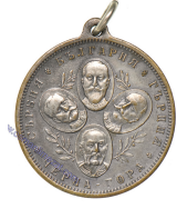
Lot: 93, Fiyat: 1.000 TL

1.DÜNYA SAVAŞI DÖNEMİ MİNELİ İTTİFAK HATIRA ROZETİ-İttifaktan çıkan İtalya'yı protesto etmek amacıyla çıkarılan rozettir. Rozetin üst kısmında sırasıyla Almanya,Osmanlı ve Avusturya bayrakları, hemen altında büyük puntolarla Almanca "SCHMACH+SCHANDE ITALIEN! (Rezil -Utan İtalyan) yazısı yer almaktadır. (Almanya GESCHÜTZT (GES. GESCHÜTZT DESCHLER u. SOHN MÜNCHEN) firması imalatı 34x22 mm Mineli Bronz)