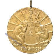
Lot: 99, Fiyat: 250 TL

İSTANBUL ÜNİVERSİTESİ 10 KASIM 1938 (MATEM MADALYONU)-Madalyonun ön yüzünde Atatürk'ün sola dönük büstü ve 1881-1938 yazısı ile siyah boyalı dış çerçevesi bulunmaktadır. Arka yüzde ise dört satır "EY TÜRK GEÇLİĞİ CÜMHÜRİYET SANA EMANETTİR" yazısı ile sağda ve solda İ(stanbul) Ü(niversitesi) harfleri yer almaktadır. Orijinal kurdeleli ve iğnelidir. (İstanbul Darphanesi - Ø30 mm - 9,40 gr Bakır/Nikel) UÖBG#CM093